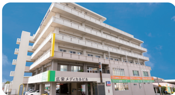
広栄メディカルビル1F